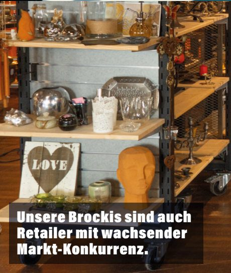
Unsere Brockis sind auch Retailer mit wachsender Markt-Konkurrenz.