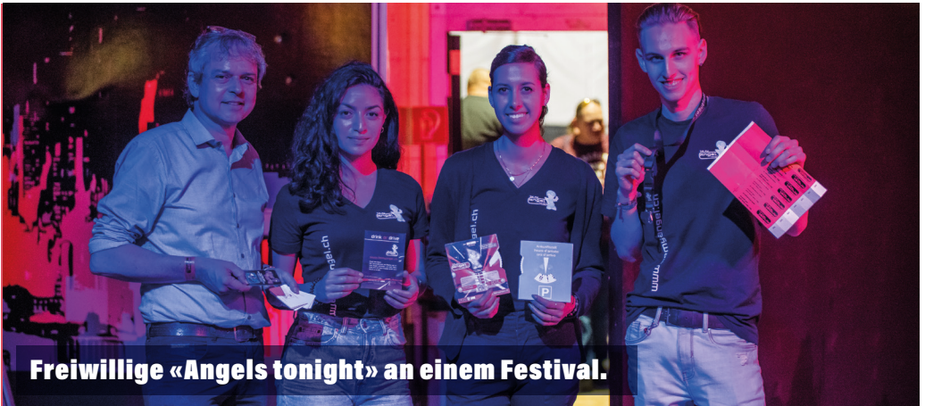
Freiwillige «Angels tonight» an einem Festival.