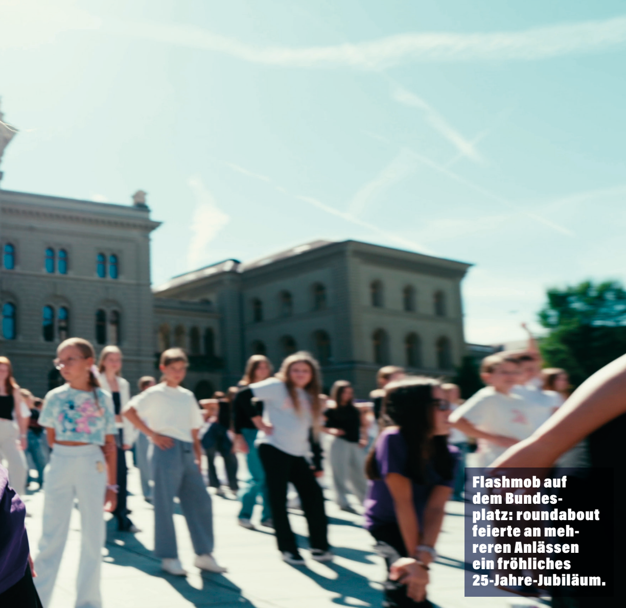
Flashmob auf dem Bundesplatz: roundabout feierte an mehreren Anlässen ein fröhliches 25-Jahre-Jubiläum.