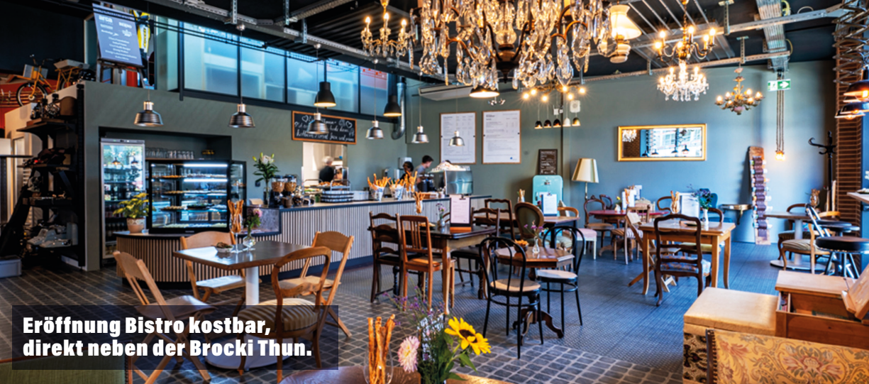
Eröffnung Bistro kostbar, direkt neben der Brocki Thun.