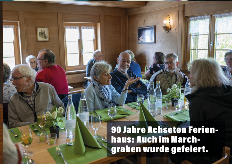
90 Jahre Achseten Ferienhaus: Auch im Marchgraben wurde gefeiert.