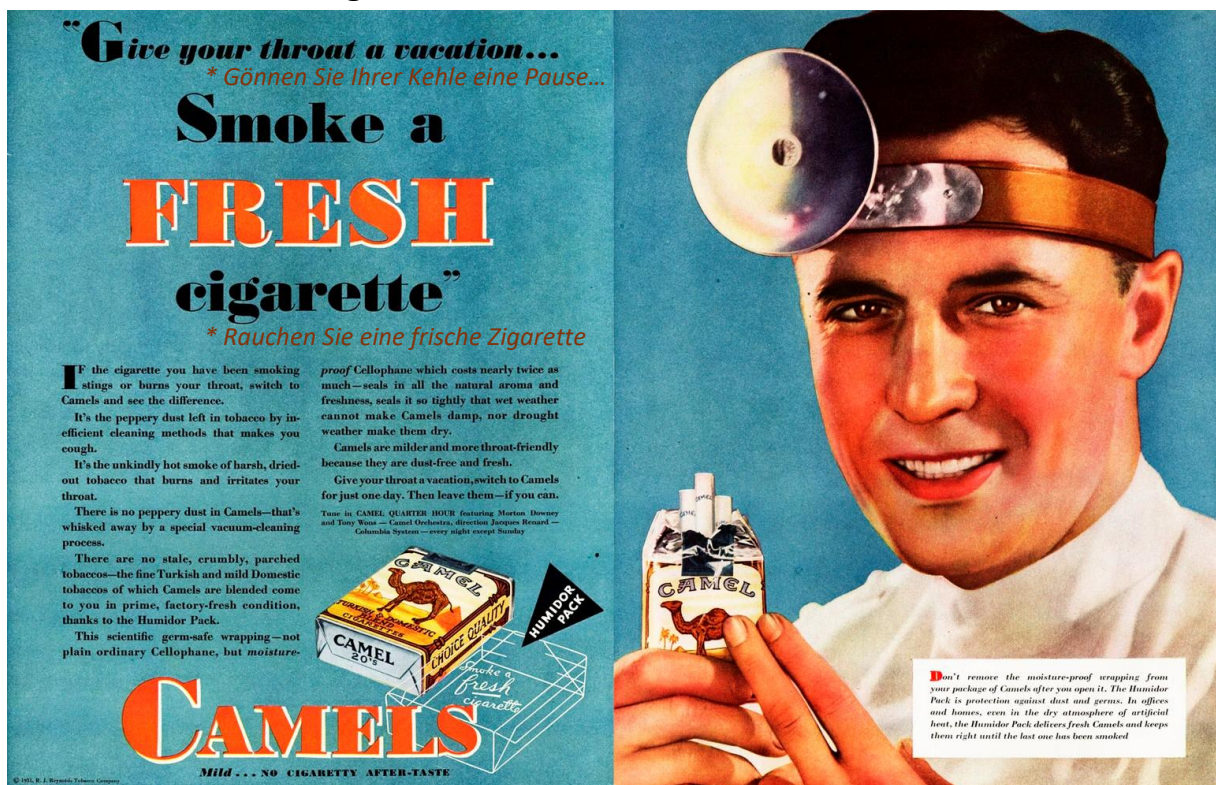
1931 (R. J. Reynolds Tobacco Company).

2. Die Printwerbung stammt aus dem Jahr 1931 aus den USA. Diskutiert zu zweit darüber und tragt eure Erkenntnisse in der Klasse zusammen.