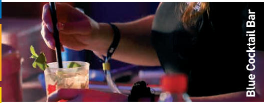
Blue Cocktail Bar