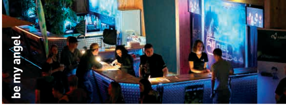
be my angel