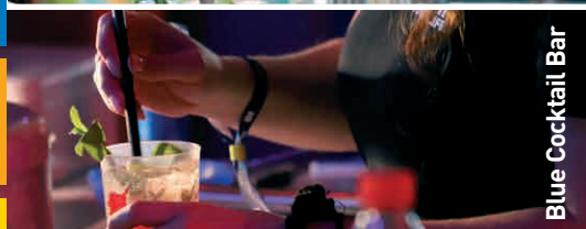
Blue Cocktail Bar