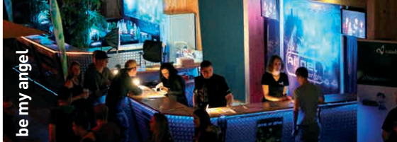
be my angel